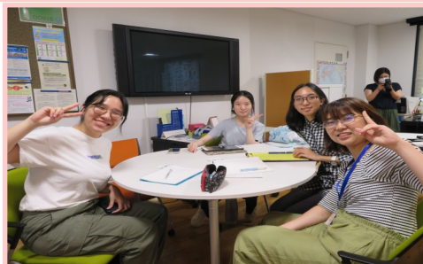
Japanese Lessons with Science Buddy