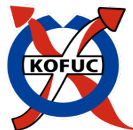
KOFUCネットワークのロゴ