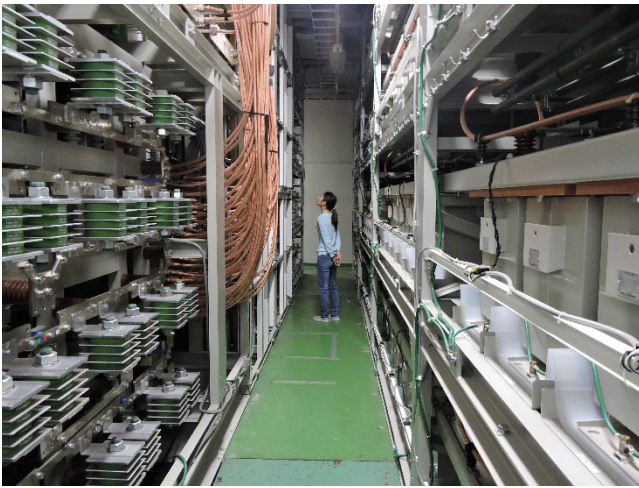
大型コンデンサーバンクシステム