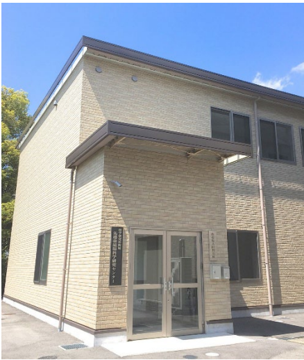
強磁場共同利用棟とセンター看板