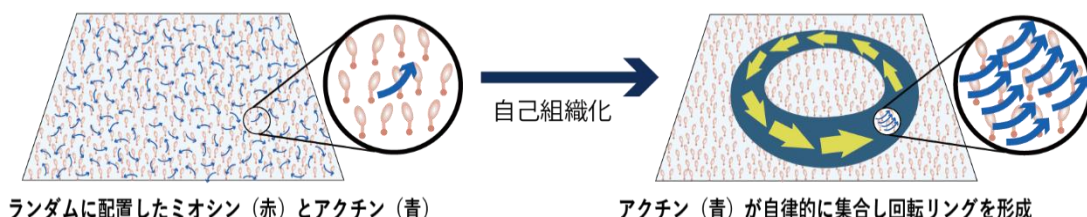
ランダムに配置したミオシン（赤）とアクチン（青）

本研究成果は、2026 年 1 月 28 日（日本時間 1 月 29 日）に米国科学誌 Proceedings of the National Academy of Sciences of the United States of America (PNAS) で公開されました。