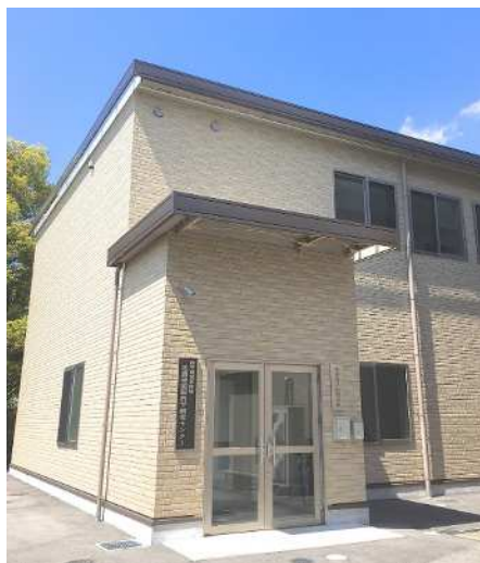
強磁場共同利用棟とセンター看板

これらのことを踏まえて、極限量子科学研究センターの超強磁場量子磁性部門と理学研究科物理学専攻が中心となって、同研究科の他専攻、さらに他部局との連携・協力の下、平成26年4月1日付で、学内共同教育研究施設である極限量子科学研究センターの一研究部門から理学研究科附属施設へと発展的に改組して、理学研究科附属先端強磁場科学研究センターになりました。