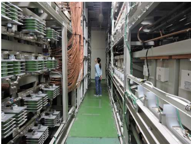
大型コンデンサーバンクシステム