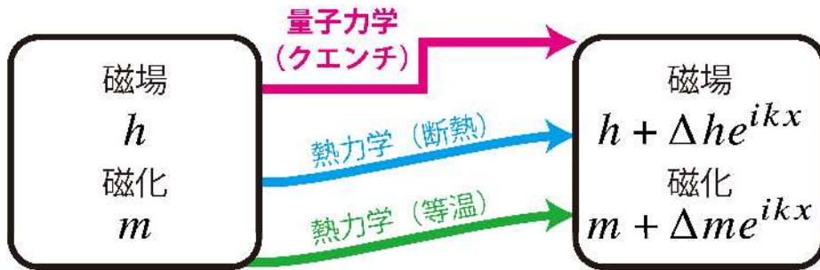
図 1 : 物質に外部から印加している磁場を \Delta h だけ増やすと、磁化が \Delta m だけ変化する。この過程が、量子力学的なクエンチ過程の場合 (赤) と、断熱容器に入れた熱力学過程の場合 (青)、そして、温度一定の熱力学過程の場合 (緑) の、3つのケースについて、感受率 \Delta m / \Delta h を比較した。