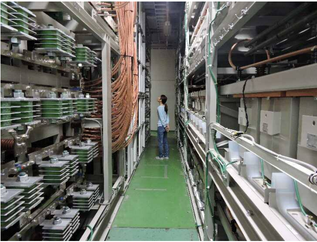
大型コンデンサーバンクシステム