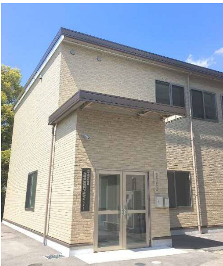
強磁場共同利用棟とセンター看板

これらのことを踏まえて、極限量子科学研究センターの超強磁場量子磁性部門と理学研究科物理学専攻が中心となって、同研究科の他専攻、さらに他部局との連携・協力の下、平成26年4月1日付で、学内共同教育研究施設である極限量子科学研究センターの一研究部門から理学研究科附属施設へと発展的に改組して、理学研究科附属先端強磁場科学研究センターになりました。