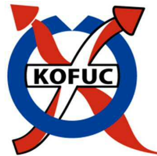
KOFUCネットワークのロゴ