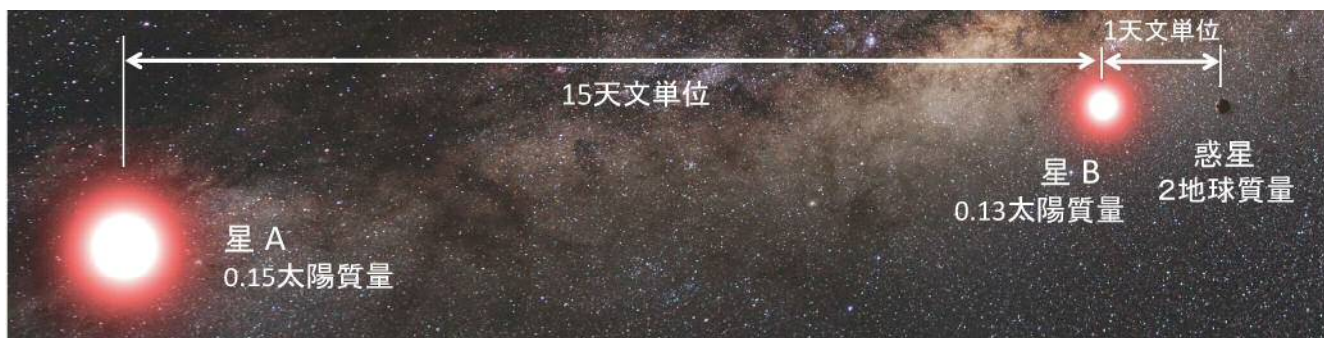
図 1:発見された連星系中の惑星の想像図

(論文題目「A Terrestrial Planet in a ~ 1 AU Orbit Around One Member of a ~ 15 AU Binary」)