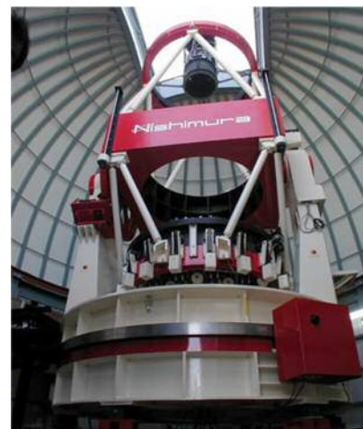
図2: MOA-II 1.8m 望遠鏡

一方、我々MOAグループは、専用1.8m望遠鏡(図2)を用いて重力マイクロレンズ現象を利用した系外惑星の探索に取り組んできました。この現象は、アインシュタインの一般相対性理論が予言する「光が重力によって曲がる」という性質のために起こります。ある星(背景光源)の前を偶然別の星(レンズ天体)が横切るとレンズ天体の重力によって背景光源からの光はあたかもレンズを通ったかのように曲げられて集光し、突然明るくなった様に見えます。普通の星がレンズとなると20日程度の間、単調に明るくなって、また同じ時間をかけて元の明るさに戻っていきます。しかし、もしこの星(主星)の周りに惑星があると、その惑星の重力の影響で単調でない増光や減光が余分に加わります(図3)。この余分な増光減光を見つける事で、そこに惑星がある事が分かり、現在までに20数個の惑星が見つかっています。