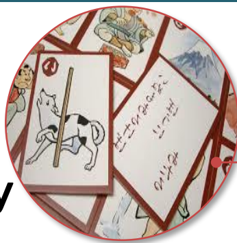
かるた Playing karuta cards