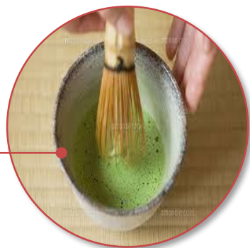
お茶 Tea ceremony