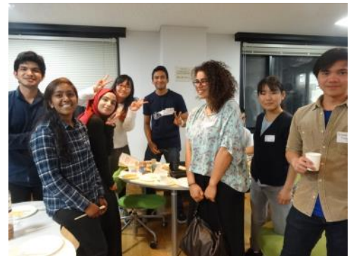
TABLE TENNIS FESTIVAL (2017.5.26)

2017年5月26日（金）に卓球場と国際交流サロンで卓球大会&手巻き寿司パーティーが開催されました。卓球大会は普段運動しない人も多い中での開催でしたがケガもなく、敵味方関係なくファインプレーには「おおー！！」という声が上がりととても盛り上がりました。卓球と手巻き寿司は同時開催だったのですが、卓球場を閉めなければならぬぎりぎりの時間までパーティーに来ない人たちもおり、かなり白熱した戦いだったようです。手巻き寿司ではみんなで韓国のとても辛い肉に挑戦したり、留学生の初納豆チャレンジがあったりととても楽しい時間となりました。普段話さない人との距離も縮まり、スポーツと食事には言葉は関係ないのだと実感できたイベントでした。